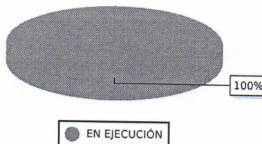
PROYECTOS POR SITUACION