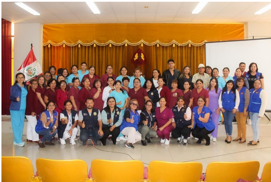
NOTA DE PRENSA 331-2024/UUI-MPS

Desde la MPS, bajo el liderazgo de nuestro alcalde Luis Gamarra Alor, seguiremos articulando esfuerzos con las instituciones de salud para llevar el control de las gestantes a partir del segundo trimestre del 2024, a través de las visitas domiciliarias con los actores sociales, con el objetivo de contrarrestar la anemia en los infantes y gestantes.